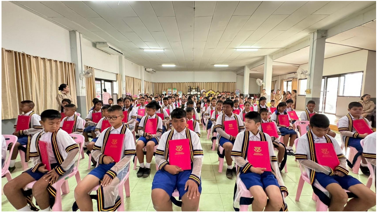
บรรยากาศขณะนักเรียนเข้าร่วมกิจกรรม