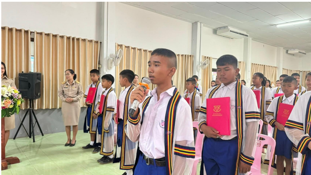
นักเรียนที่จบการศึกษาระดับประถมศึกษากล่าวคำปฏิญาณตน