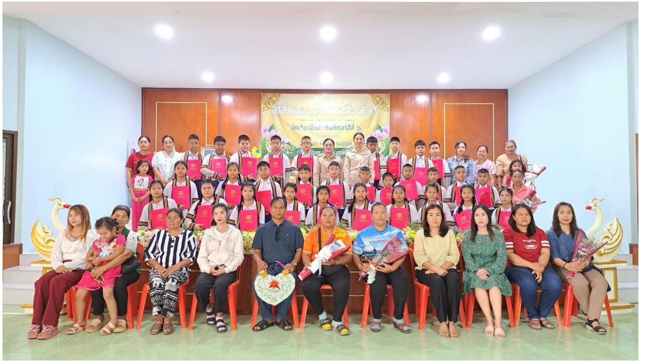
คณะครู, คณะกรรมการสถานศึกษา และ ผู้ปกครอง ร่วมถ่ายภาพเป็นที่ระลึก