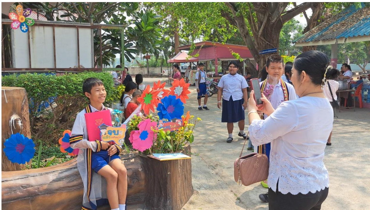
นักเรียนและผู้ปกครองถ่ายภาพตามซุ้มต่าง ๆ เพื่อเป็นที่ระลึก