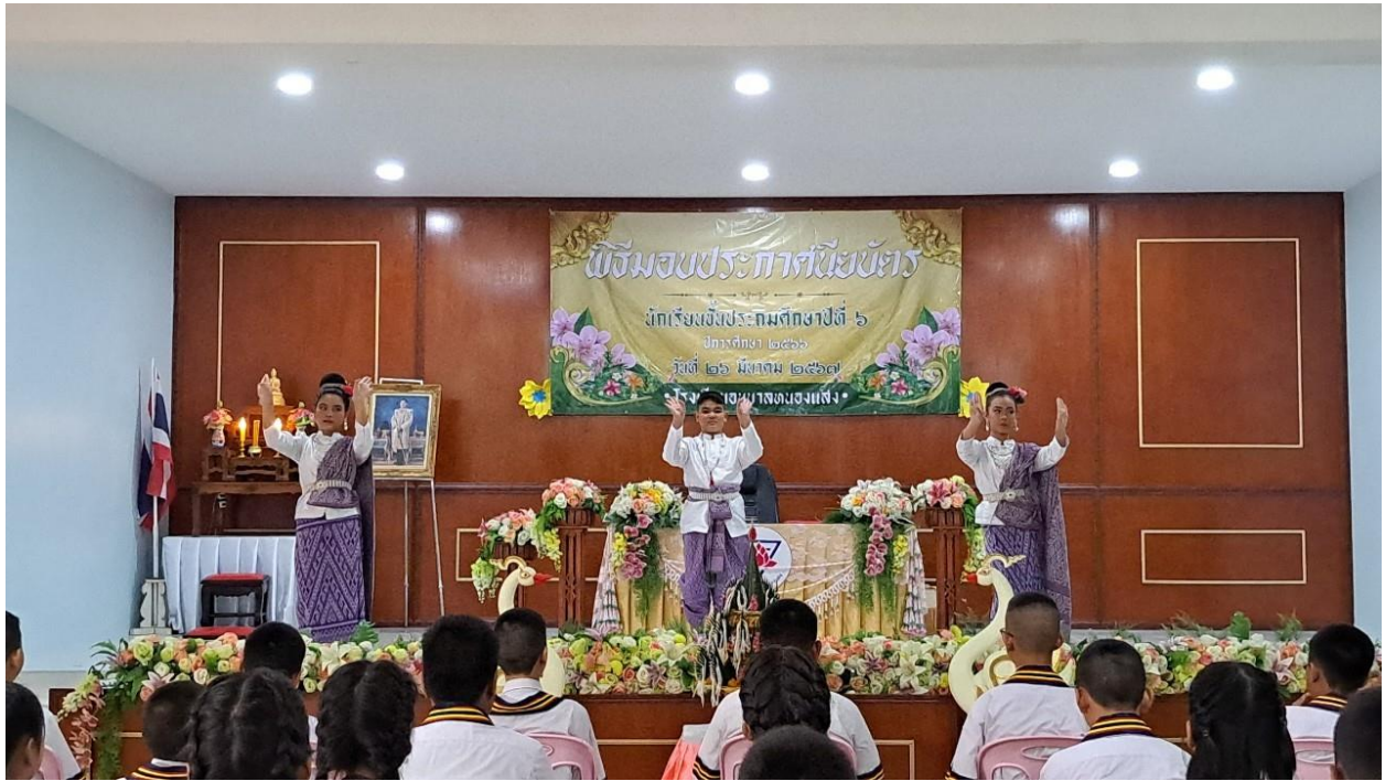
การแสดงของชมรมนาฏศิลป์ ชุด รำบายศรี