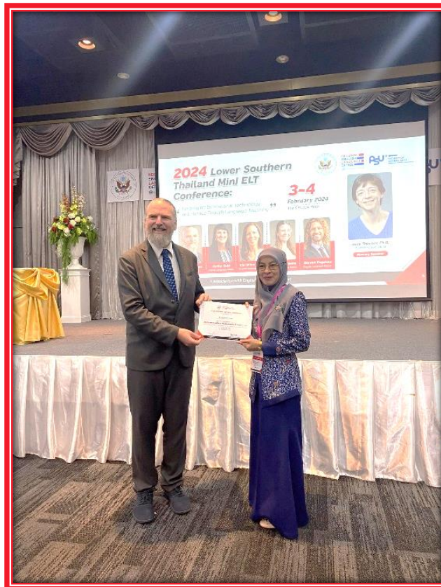
พิธีปิด และมอบเกียรติบัตรแก่ผู้เข้าร่วมอบรม