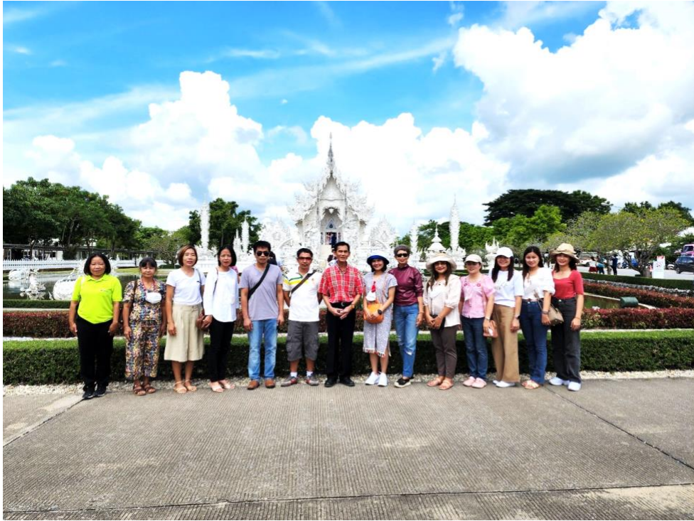
เยี่ยมชมวัดร่องขุน