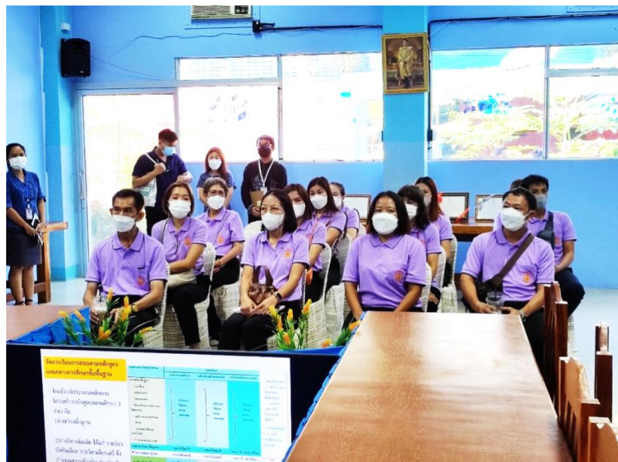
ฐาน หลักสูตรสถานศึกษารองรับเขตพัฒนาเศรษฐกิจพิเศษ