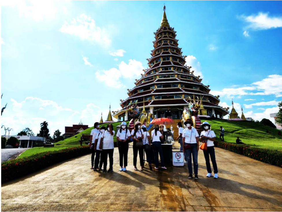
เยี่ยมชมวัดห้วยป่ากิ้ง