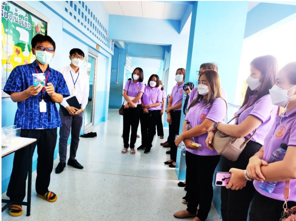
ฐาน ห้องปฏิบัติการเพาะเลี้ยงเนื้อเยื่อ