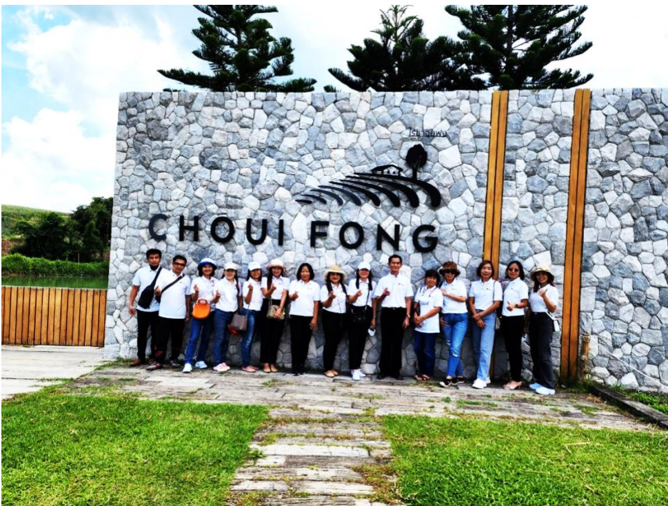
เยี่ยมชมไร่ชาฉุยฟง