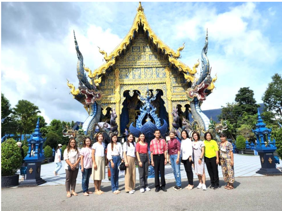
เยี่ยมชมวัดร่องเสือเต้น