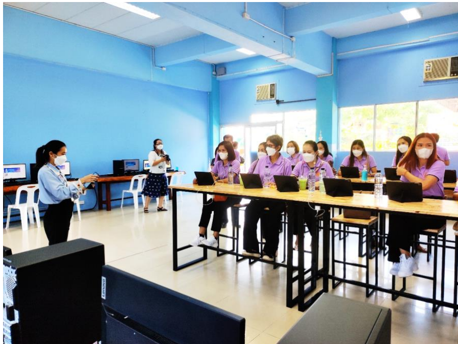
ฐาน Digital Library